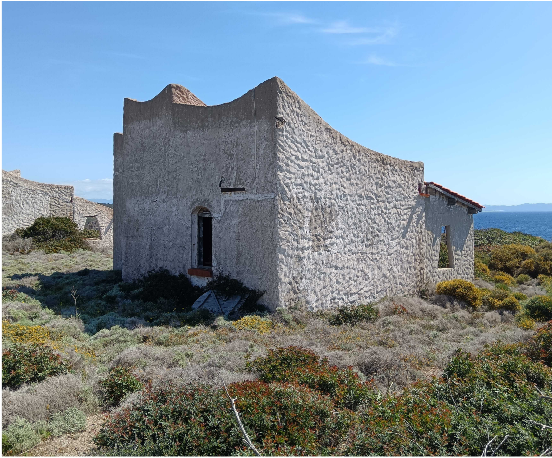
3 - Fabbricato 15