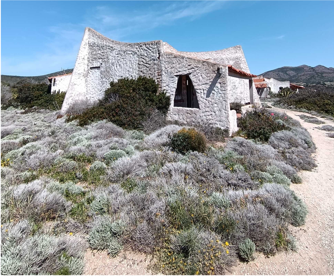
6 - Fabbricato 14