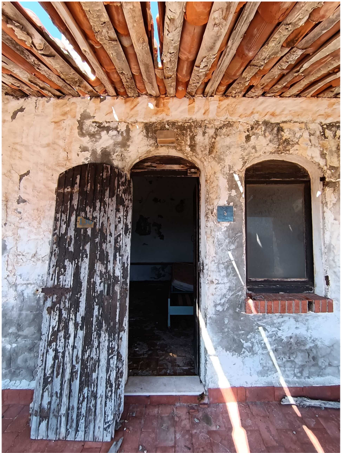
13 - Fabbricato 10