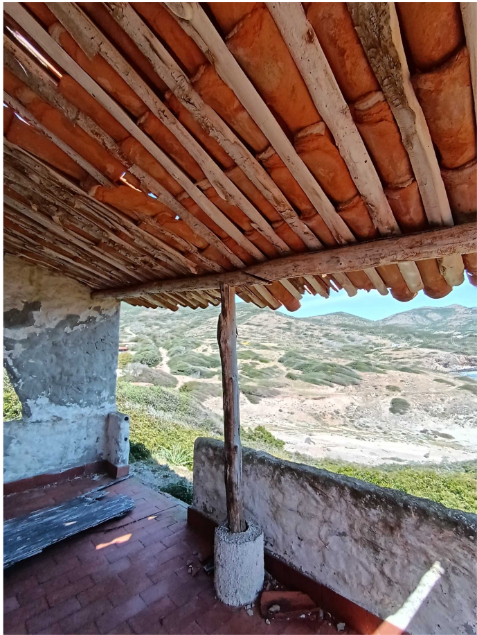
16 - Fabbricato 09