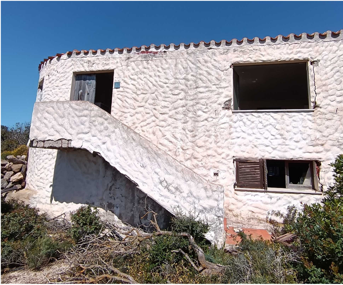
2 - Fabbricato 16