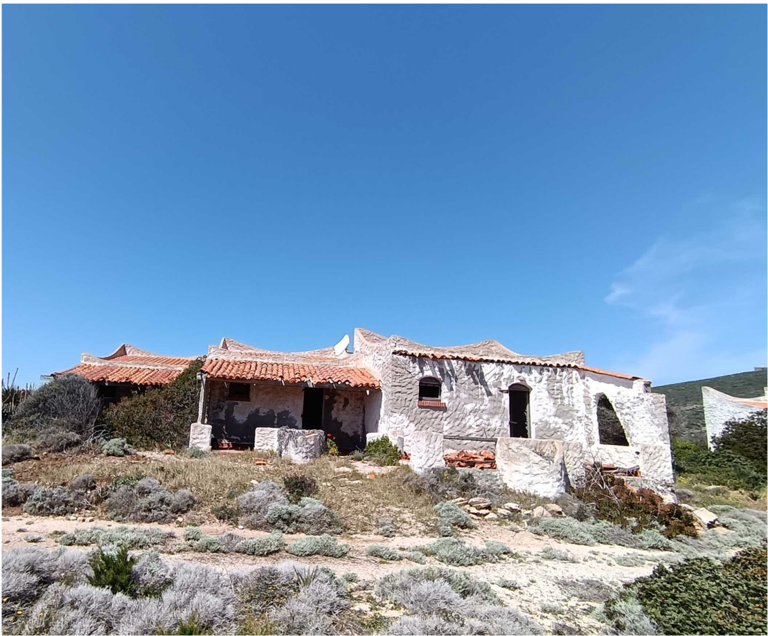
9 - Fabbricato 12