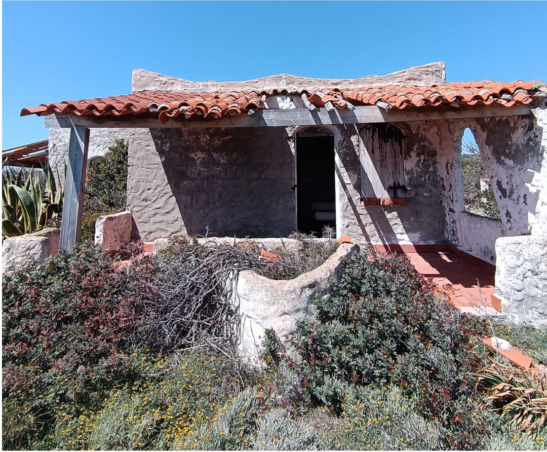
8 - Fabbricato 13