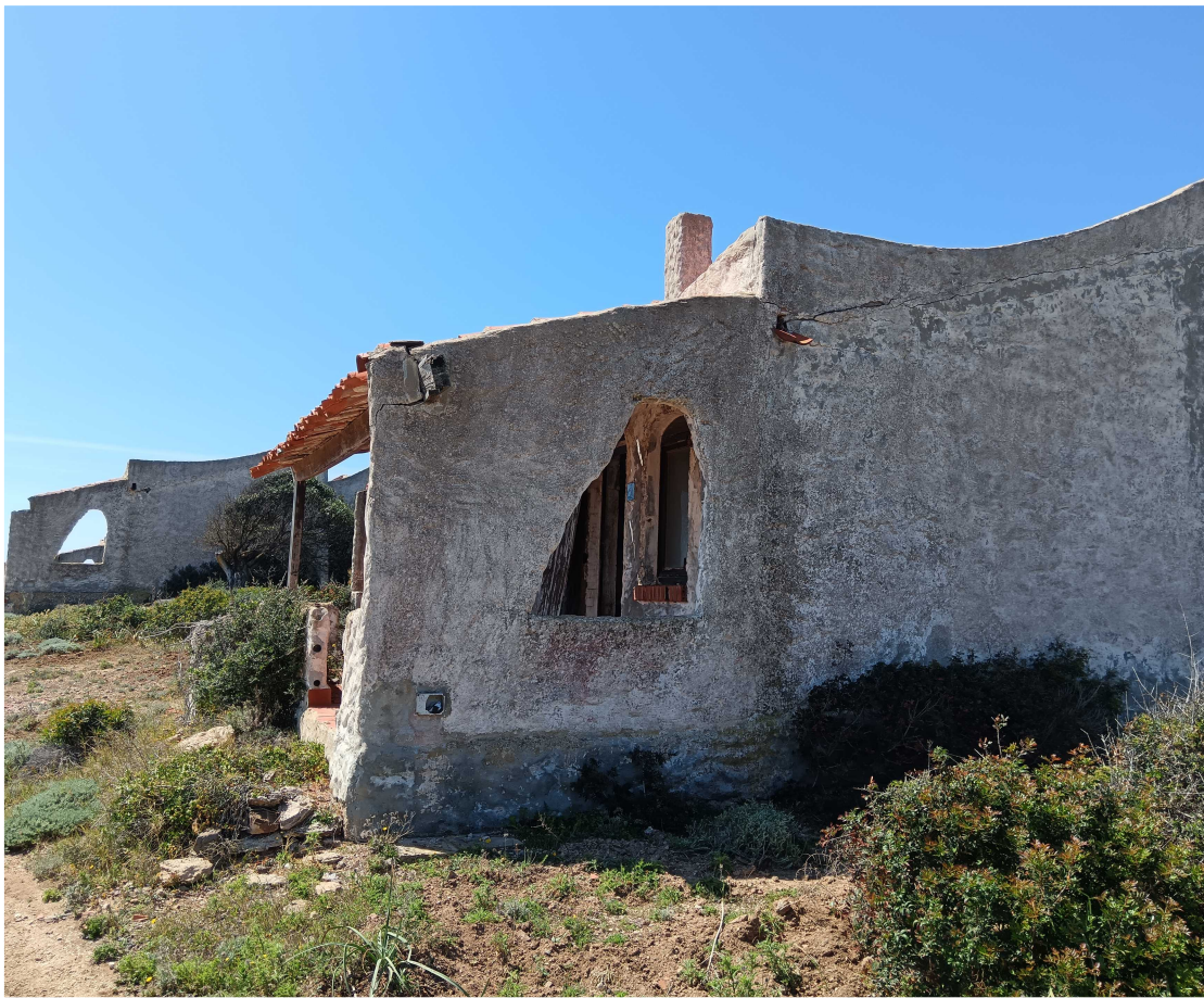
11 - Fabbricato 11