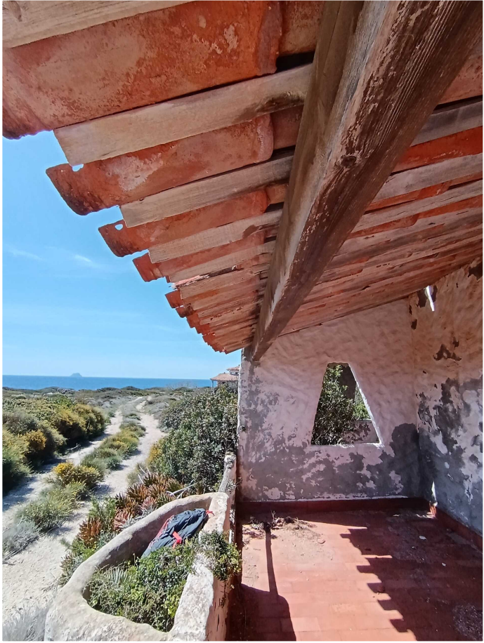
5 - Fabbricato 15