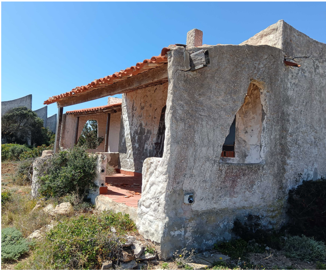
12 - Fabbricato 11