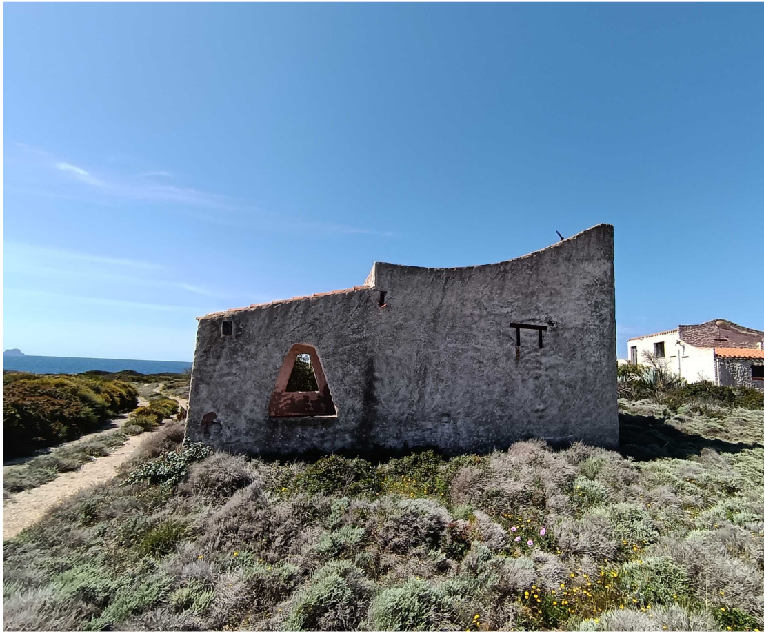
4 - Fabbricato 15