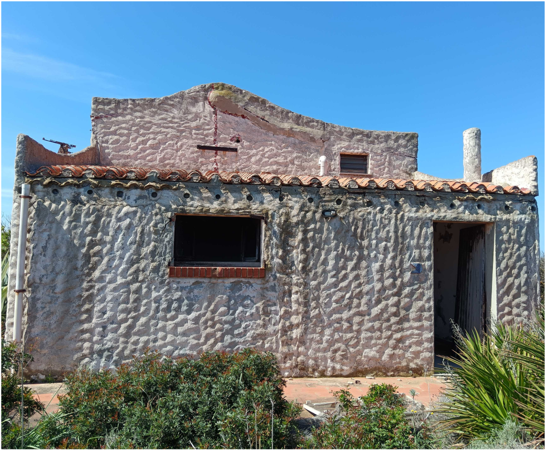
1 - Fabbricato 16