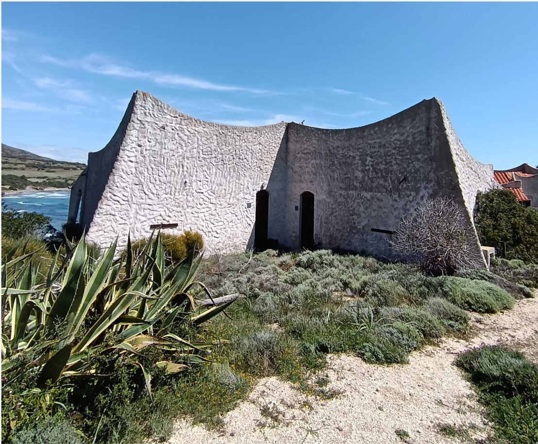
14 - Fabbricato 10