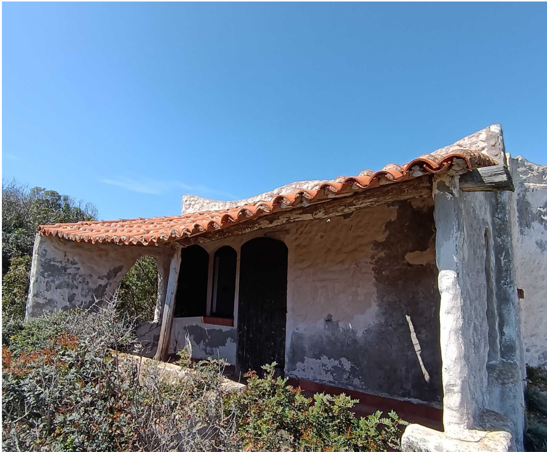
15 - Fabbricato 10