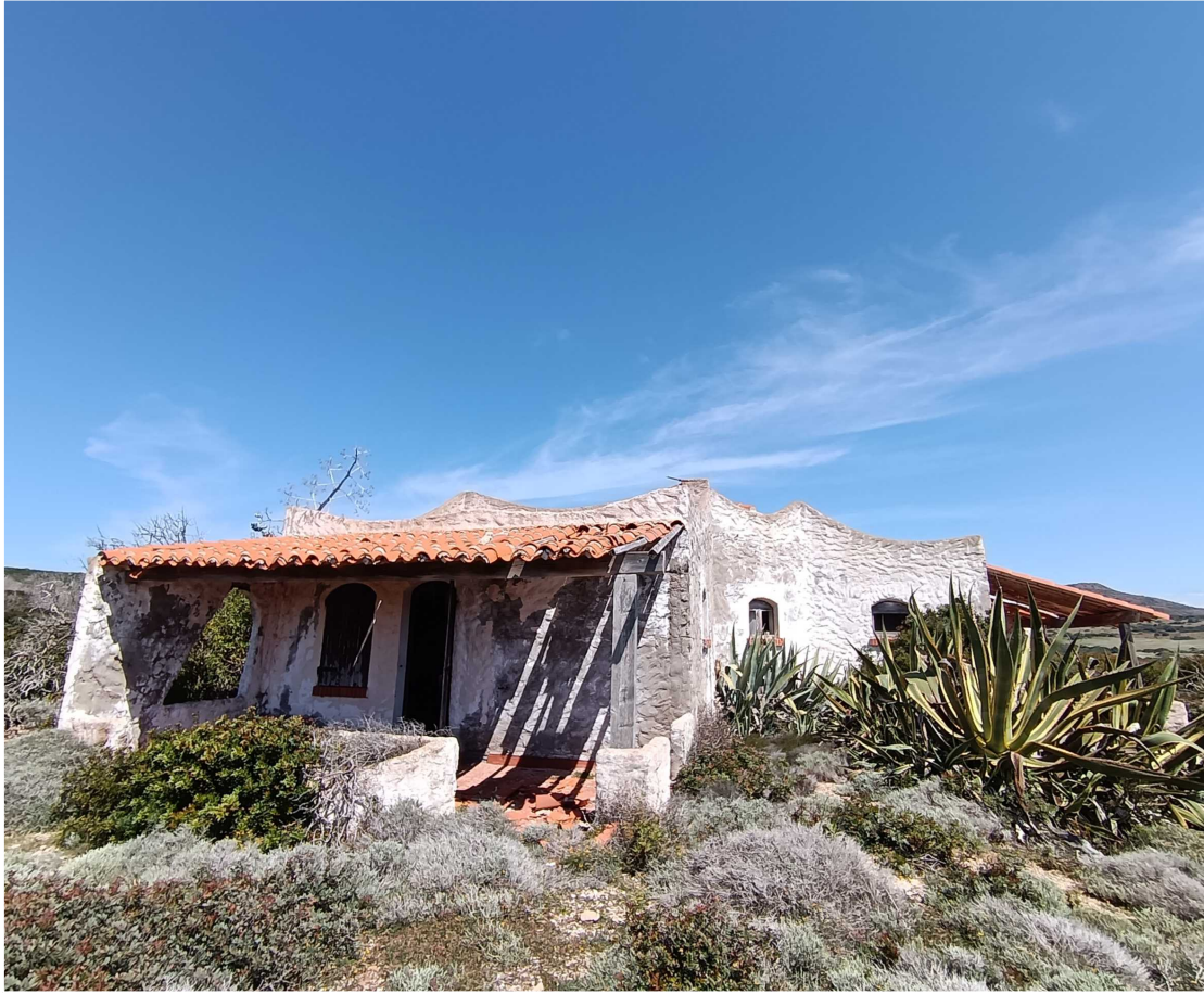
7 - Fabbricato 13