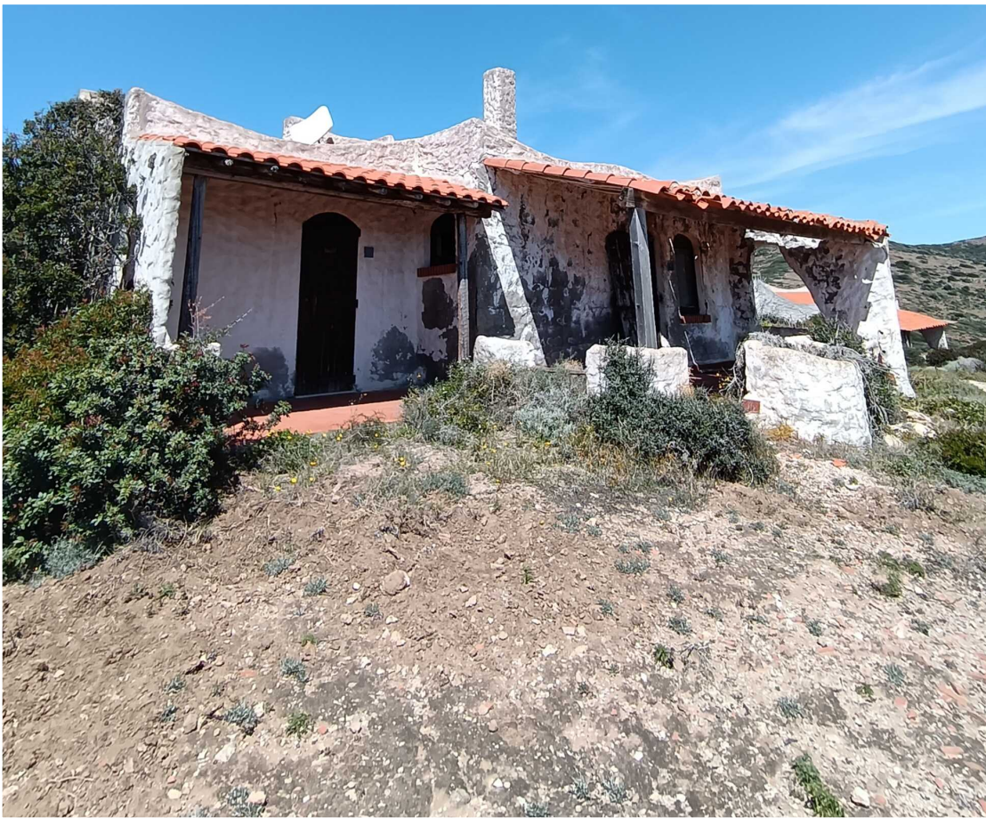
10 - Fabbricato 11